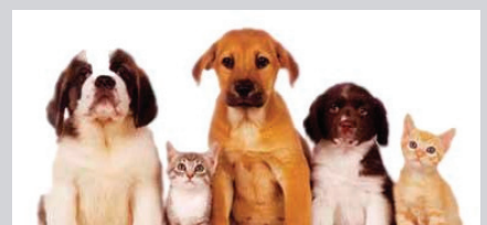
Caspa de animales