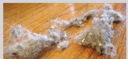
Ácaros del polvo