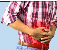
Dolor de estómago y cuerpo