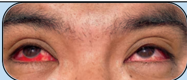
Ojos rojos o hinchados*