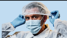
Cobertura para la cabeza o cabello